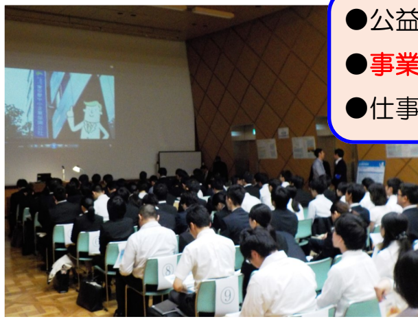
東京しごと財団 広報リーダー サイようくん